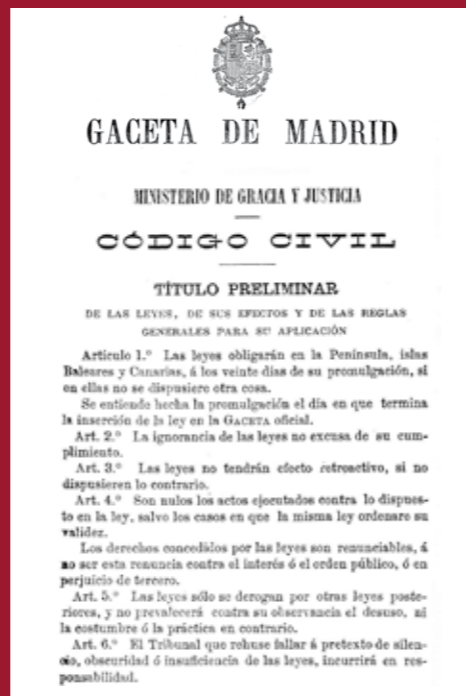
Código Civil (1889).

el de Florencio García Goyena, fue un texto cuya aprobación previó ya la Constitución de 1812, pero que no se alcanzó hasta el año 1889. Fue finalmente la Comisión de Codificación, que continúa hoy día desarrollando su importante labor técnica, la que redactó el texto que el Gobierno remitió a las Cortes.