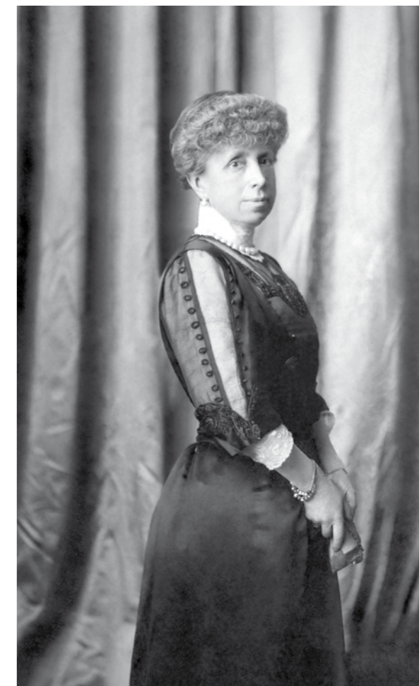
Retrato de la reina María Cristina de Habsburgo Lorena (1858-1929). Hacia 1910.

En este año 2019 se cumplen los ciento treinta años de la promulgación del Código Civil y los noventa años del fallecimiento de la Reina María Cristina, que firmó la promulgación. El Código Civil, fruto de un largo proceso prelegislativo, durante el cual se elaboraron numerosos y valiosos proyectos, entre los que siempre se recuerda