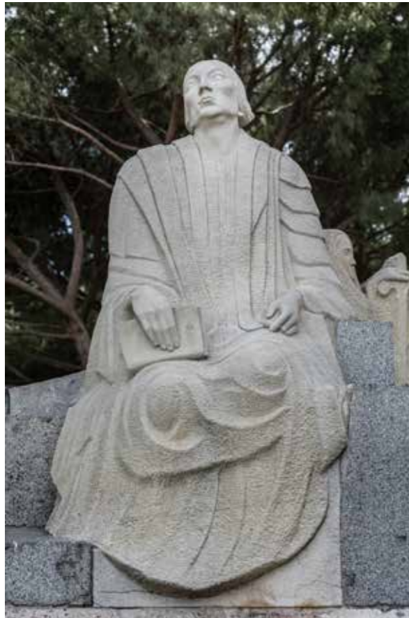
José Ma Palma Burgos, Monumento a Concepción Arenal (1934). Madrid.