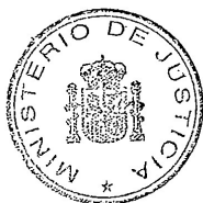
Juan Fernando López Aguilar

Madrid, a 7 de noviembre de 2006 EL MINISTRO DE JUSTICIA